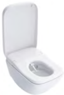
NEOREST® WX1 WC avec WASHLET® intégré

Aucun compromis n'a été fait au détriment du design ou des technologies. L'équipement technique est dissimulé dans la céramique, ce qui rend les nombreuses fonctions spéciales du NEOREST® WX invisibles de l'extérieur.