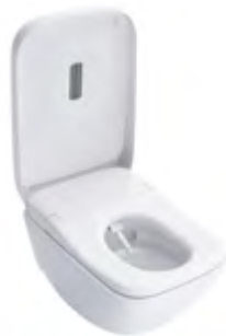
NEOREST® WX2 WC avec WASHLET® intégré

WASHLET® pour NEOREST® WX2* télécommande incluse